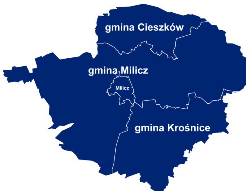
Rys. 1 Położenie gminy Cieszków na tle powiatu milickiego.

Gmina Cieszków leży w północno-wschodniej części województwa dolnośląskiego, na północy powiatu milickiego. Od stolicy województwa miejscowość Cieszków oddalona jest o około 70 km. Gmina graniczy z: gminą Milicz, Zduny (województwo wielkopolskie) i Jutrosin (województwo wielkopolskie). Północna granica gminy Cieszków stanowi jednocześnie granicę województwa dolnośląskiego.